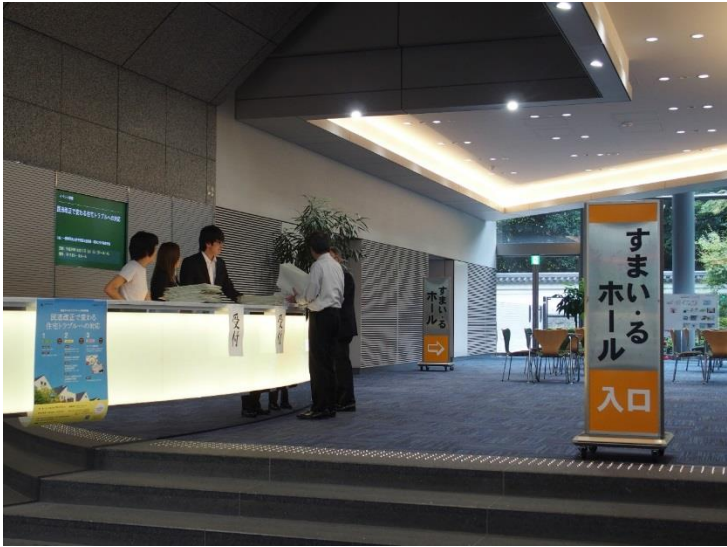
シンポジウム受付